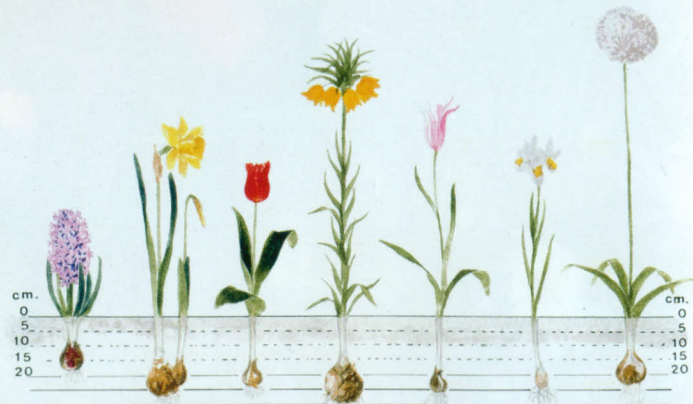
v.l.n.r.: Hyazinthe, Osterglocke, Tulpe, Kaiserkrone, Franz. Tulpe, Iris, Zierlauch