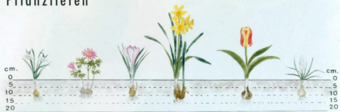
v.l.n.r.: Schneeglöckchen, Strahlenanemone, Krokus, Narzisse, Bot. Tulpe, Traubenhyazinthe